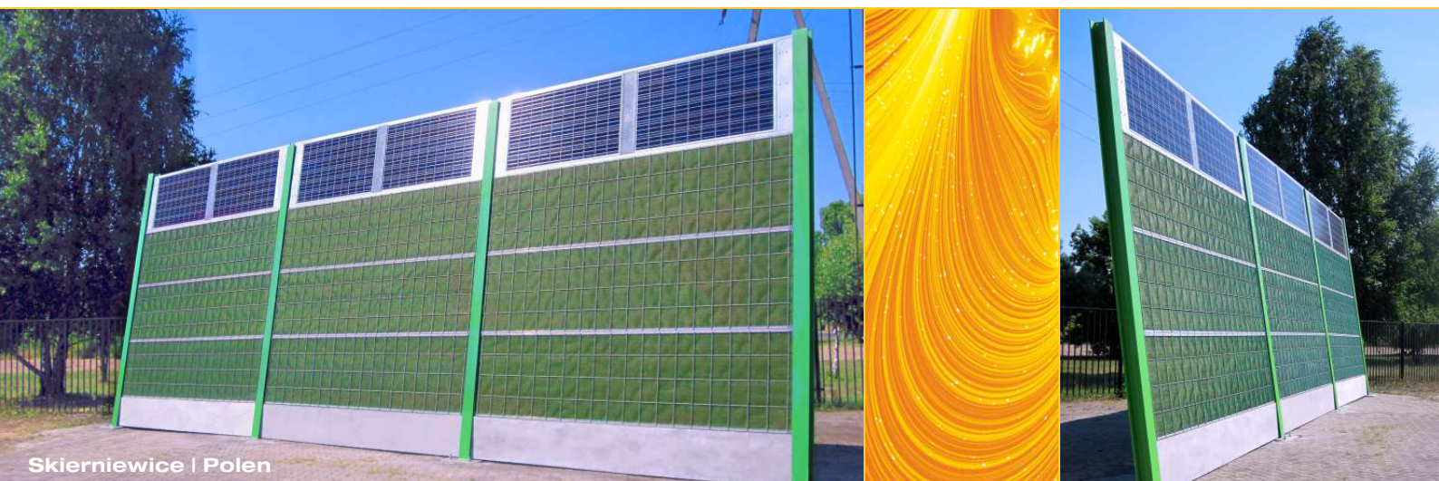
Skierniewice | Polen