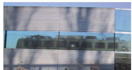
Projekt Burgweinting (Bahn)