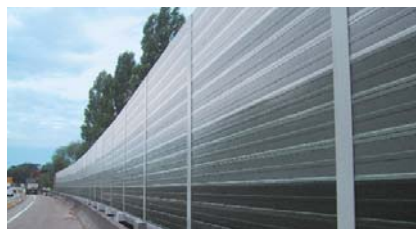
Projekt Straßburg M65