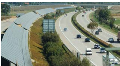
Projekt Freising A92

In Zusammenarbeit mit unserer stetig wachsenden Kundschaft lieferte Kohlhauer bisher über 300.000 m 2 Lärmschutzelemente in unterschiedlichsten Ausführungen als opake oder transparente Lösung, ob in Holz, Alu, Silikat- oder Acrylglas, Polycarbonat oder mit integrierter Photovoltaik; Kohlhauer bietet das umfassende Programm für innovative Lösungen in Lärm- und Umweltschutz.